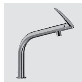
Team 711 801