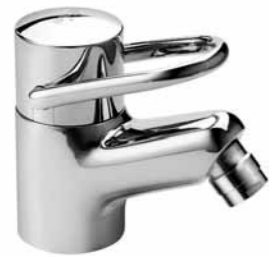
Mitigeur de bidet 9.38100