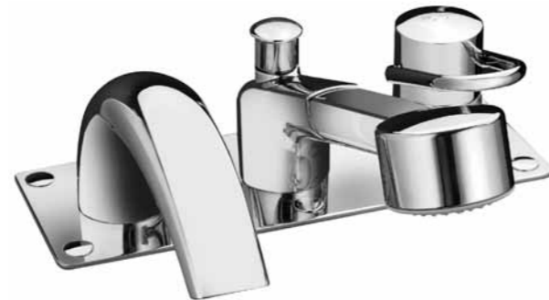
Garniture de remplissage avec plaque de recouvrement pour baignoire 3 trous 9.20560 aussi en exécution sans plaque de recouvrement