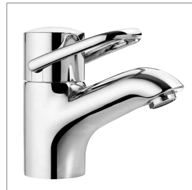
Mitigeur de lavabo avec goulot fixe, saillie 110 mm 9.38835