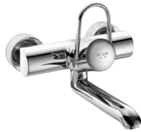
Mitigeur mural 9.35470/9.35475