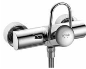
Mitigeur de douche 9.31130