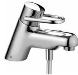
Mitigeur encastré de bain 9.37095