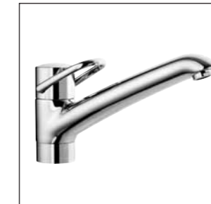
Mitigeur d'évier avec goulot orientable 9.39512