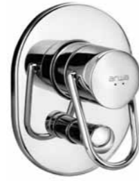
Mitigeur encastré avec inverseur 9.30700