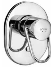
Mitigeur encastré sans inverseur 9.31700