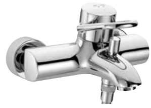
Mitigeur de bain 9.30110