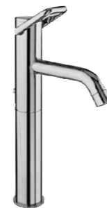
Mitigeur de lavabo avec goulot fixe réhaussé (hauteur 300 mm) saillie 150 mm 9.88835