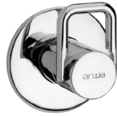
Mitigeur encastré sans inverseur 9.81700 ou avec inverseur 9.80700