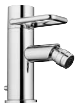
Mitigeur de bidet 9.88202