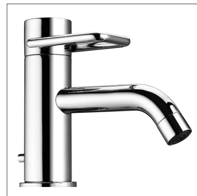
Mitigeur de lavabo avec goulot fixe, saillie 130 mm 9.88837, également disponible avec saillie 110 mm 9.88827