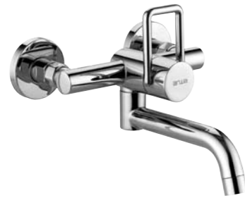
Mitigeur mural 9.85480/85485 goulot 175 mm/225 mm