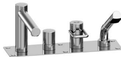
Garniture de remplissage pour baignoire 4 trous 9.20654/9.20604 avec/sans plaque. Egalement disponible en version 3 trous avec goulot déplacé 9.20568/9.20518