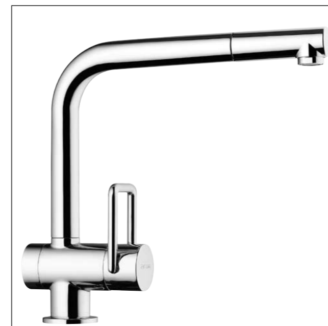
Mitigeur d'évier avec goulot extensible 9.89673