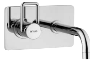
Mitigeur de lavabo mural encastré 9.85780/9.85785 goulot 175 mm/225 mm