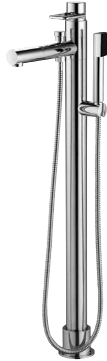
Mitigeur de bain sur colonne 9.80226