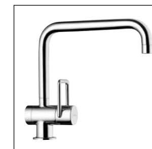
Mitigeur d'évier avec goulot orientable 9.89532