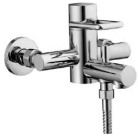
Mitigeur de bain 9.80208