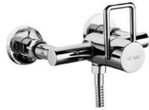
Mitigeur de douche 9.81205