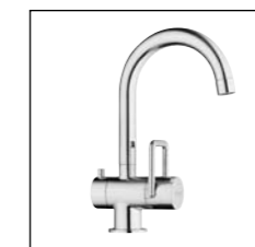
Mitigeur de lavabo avec goulot orientable, saillie 135 mm 9.88726