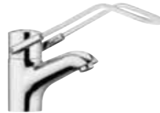
Mitigeur de lavabo 9.38835.100.094/9.38752.100.094 Saillie 110 mm/145 mm