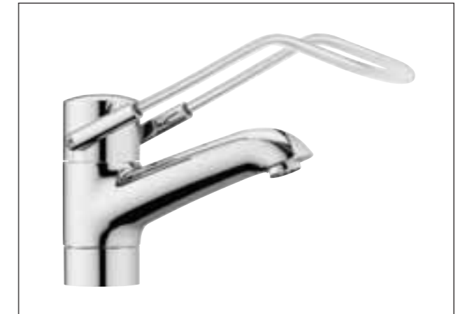
arwa-clinic Mitigeur de lavabo 9.38752.100.094 (avec cartouche à limitations fixes 5.76001.000.000)