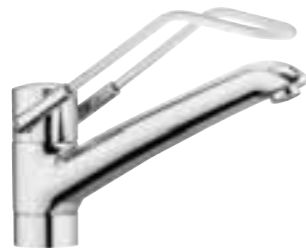
Mitigeur d'évier à bec orientable 9.39512.100.094