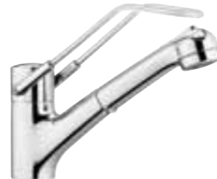
Mitigeur d'évier à douchette extensible 9.39655.100.094