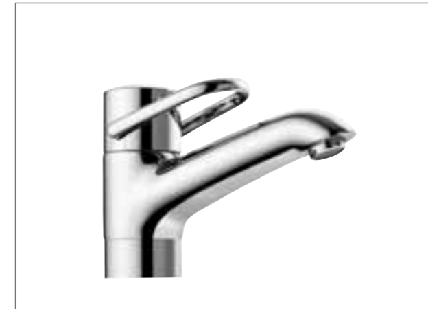
arwa-class 9.38752.100.001 (avec cartouche Ecototal 1.88008.000.000) ou 9.38752.100.501 (avec cartouche à limitations fixes 5.76001.000.000)

arwa-class possède déjà un levier de commande très ergonomique qui répond parfaitement aux besoins des utilisateurs ciblés. En cas de nécessité, arwa-class se convertit en arwa-clinic et inversement (kit de transformation du levier de commande 9.63685.100.001). D'où une adaptation flexible aux besoins, par exemple lors du changement d'occupants dans les chambres des établissements de soins.