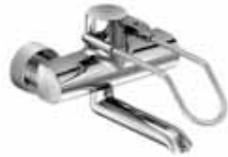
Mitigeur mural 9.35630.100.094/9.35635.100.094