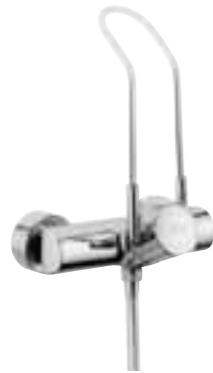
Mitigeur de douche 9.31130.100.094