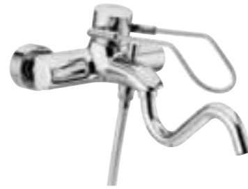
Mitigeur combi 9.35655.100.094