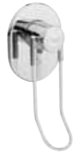
Mitigeur encastré sans inverseur 9.31700.100.094