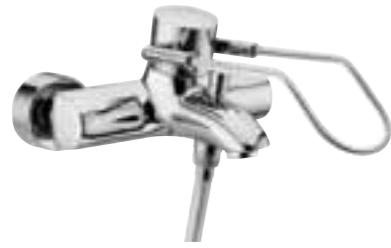
Mitigeur de bain 9.30110.100.094