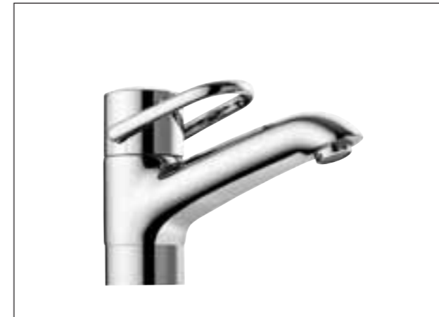
arwa-class 9.38752.100.001 (mit Kartusche Ecototal 1.88008.000.000) oder 9.38752.100.501 (mit Kartusche mit fixen Anschlägen 5.76001.000.000)

Bereits der arwa-class hat einen besonders bedienungsfreundlichen Griff, der auf die hier besprochenen Anwendergruppen optimal zugeschnitten ist. Bei Bedarf kann der arwa-class problemlos auf den arwa-clinic umgerüstet werden und umgekehrt (Hebel-Umrüstset 9.63685.100.001). Dies ermöglicht eine flexible Anpassung an die jeweiligen Bedürfnisse, z. B. bei wechselnden Zimmerinsassen von Pflegeheimen.