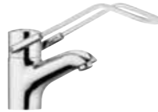
Waschtischmischer 9.38835.100.094/9.38752.100.094 Auslauf 110 mm/145 mm