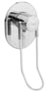
UP-Mischer ohne Umsteller 9.31700.100.094