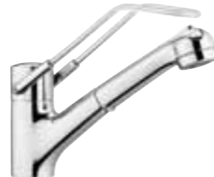
Spültischmischer mit umstellbarer Auszugsbrause 9.39655.100.094