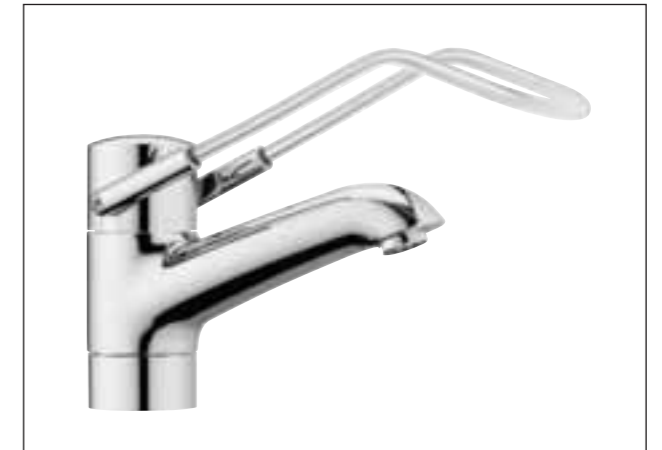
arwa-clinic Waschtischmischer 9.38752.100.094 (mit Kartusche mit fixen Anschlägen 5.76001.000.000)