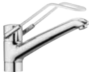
Spültischmischer mit Schwenkauslauf 9.39512.100.094