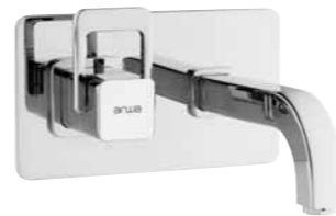
Mitigeur mural encastré 9.75480/9.75485