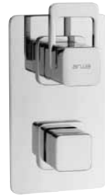
Mitigeur encastré avec inverseur 9.70700