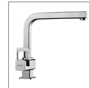
Mitigeur d'évier avec goulot orientable 9.79532