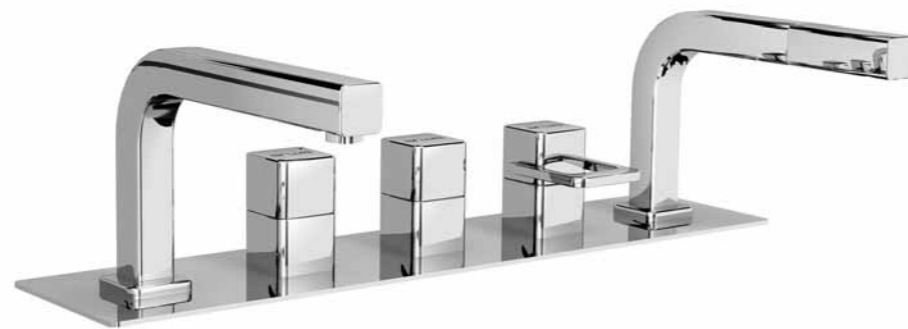
Garniture de remplissage pour baignoire 5 trous 9.20663, également disponible en version 4 trous pour goulot séparé, dans les deux cas avec ou sans plaque de recouvrement