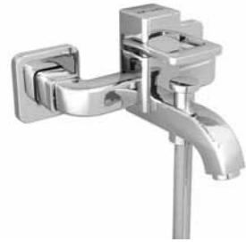
Mitigeur de bain 9.70110