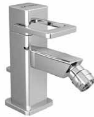
Mitigeur de bidet 9.78100