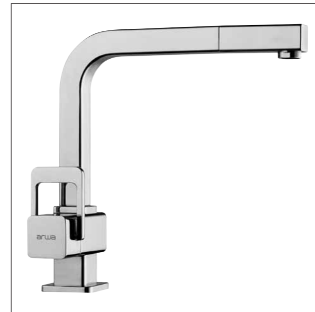
Mitigeur d'évier avec goulot extractible 9.79673