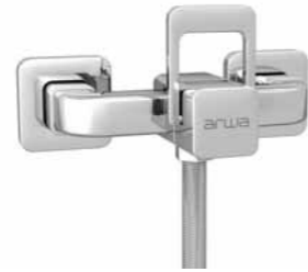
Mitigeur de douche 9.71130