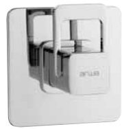
Mitigeur encastré sans inverseur 9.71700