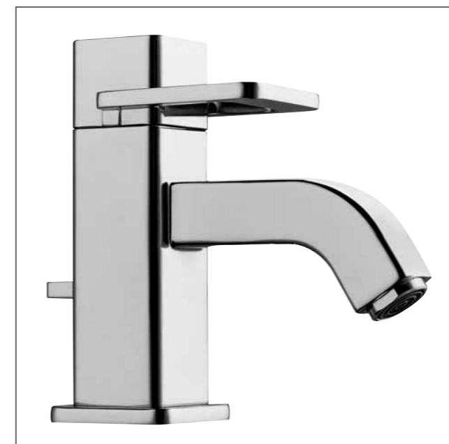
Mitigeur de lavabo avec goulot fixe, saillie 110 mm 9.78827, également disponible avec saillie 130 mm 9.78837 et en tant que mitigeur sur colonne (hauteur 321 mm) avec saillie 130 mm 9.78885